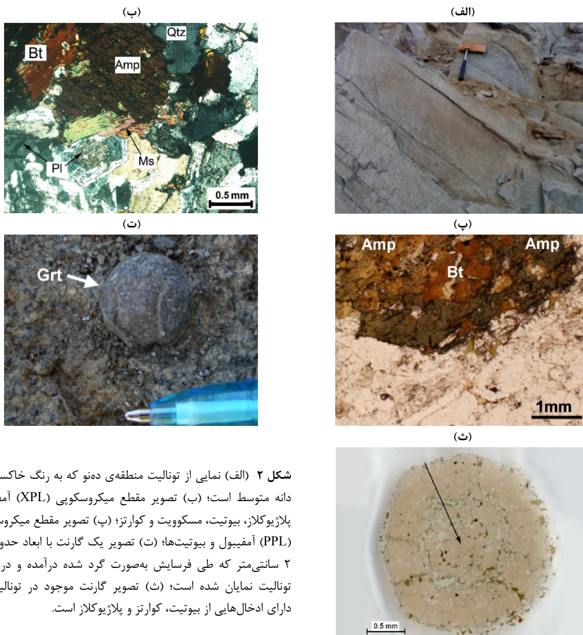
شکل ۲ (الف) نمایی از تونالیت منطقه‌ی دهنو که به رنگ خاکستری و دانه متوسط است؛ (ب) تصویر مقطع میکروسکوپی (XPL) آمفیبول، پلاژیوکلاز، بیوتیت، مسکوویت و کوارتز؛ (پ) تصویر مقطع میکروسکوپی (PPL) آمفیبول و بیوتیت‌ها؛ (ت) تصویر یک گارنت با ابعاد حدود ۱ تا ۲ سانتی‌متر که طی فرسایش به صورت گرد شده درآمده و در سطح تونالیت نمایان شده است؛ (ث) تصویر گارنت موجود در تونالیت که دارای ادخال‌هایی از بیوتیت، کوارتز و پلاژیوکلاز است.

پذیرفت (جدول ۲). بیوتیت‌ها در نمودار رده‌بندی میکاها (برگرفته از [۲۲]) بیشتر در گستره‌ی بین ترکیب آنیت تا سیدروفیلیت قرار می‌گیرند (شکل ۳-ب). فلدسپار: پلاژیوکلازها ۴۵ تا ۵۰ درصد سنگ را تشکیل می‌دهند و به صورت نیمه خودشکل تا خودشکل و دارای ماکل پریکلین و کارلسیادند (شکل ۲-ب). پلاژیوکلازها سوسوریتی شده‌اند و بیشترین دگرسانی در مرکز آنها صورت گرفته است. پلاژیوکلازها به صورت غالب با منطقه‌بندی نرمال تا نوسانی بوده (An 45-54 ) و بیشتر از نوع پلاژیوکلازهای آندزین-لابرادوریت هستند (شکل ۳-الف). نتایج آنالیز این کانی در جدول ۳ آورده